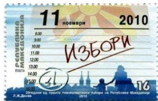
Timbre de la Poste macédonienne à l'occasion des 20 ans des premières élections multipartites en Macédoine (ФДЦ 19/2010, 11 novembre 2010)

Les premières élections parlementaires, suite à l'indépendance de la République de Macédoine en 1991, ont eu lieu en octobre 1994.